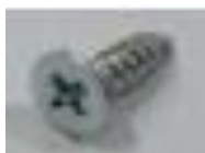
4x bezp. šrouby