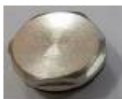
1x záslepka (E)