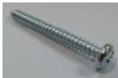
4x upevňovací šrouby (C)