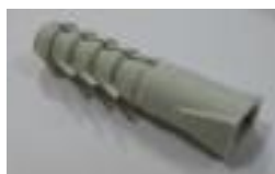
4x hmoždinka (B)