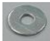
4x podložka (D)