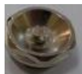
1x odvoduš. ventil (F)