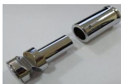
4x držák (A)