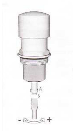
Splachovací ventil samouzavírací ze zdi