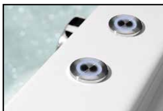
ATTRACTION HYDRO + COLORTERAPIA