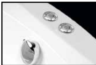
ACTIVE HYDRO + COLORTERAPIE