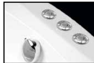
ACTIVE HYDRO AIR + COLORTERAPIE