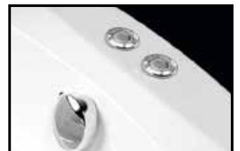
ACTIVE HYDRO AIR