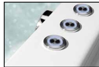
ATTRACTION HYDRO AIR + COLORTERAPIE