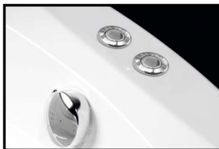
ACTIVE HYDRO + COLORTERAPIE