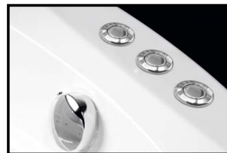
ACTIVE HYDRO AIR + COLORTERAPIE