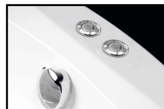
ACTIVE HYDRO AIR